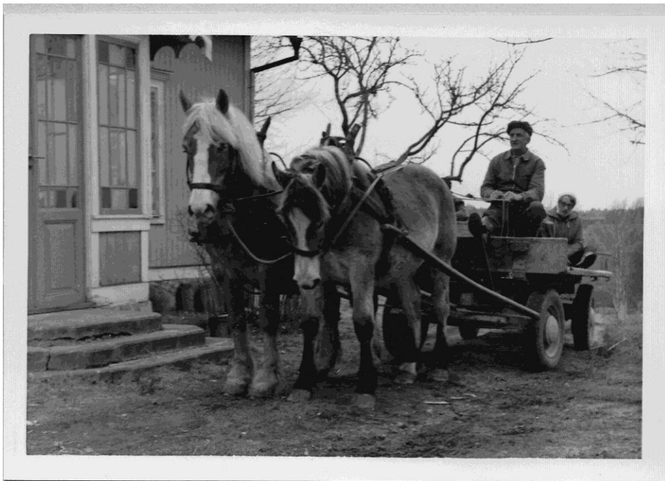
7 maj 1966