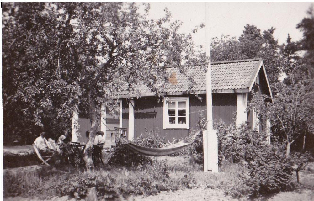
Stugan Erikslund i Kasen.