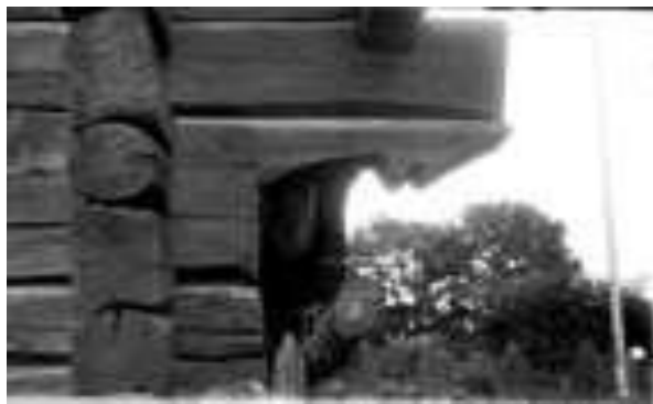
Korten tillhör Upplandsmuseet. Foto: Paul Sandberg, 1932. Konsol till loftbod.