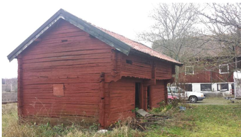
Nytagen bild på loftbod och bakomvarande ladugård/stall.

När jag skulle bygga nytt valde jag ett hus från Eko-Hus i Uppsala. Huset är ett lågenergihus och isoleringen är granfiber. Huset har vattenburen golvvärme och vattnet värms upp av en frånluftsvärmepump samt min egenbyggda solfångare som i huvudsak ger värme från mars – november.