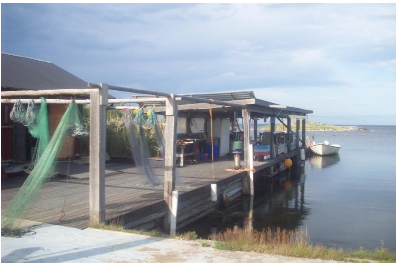
Fiskeläget idag 2019