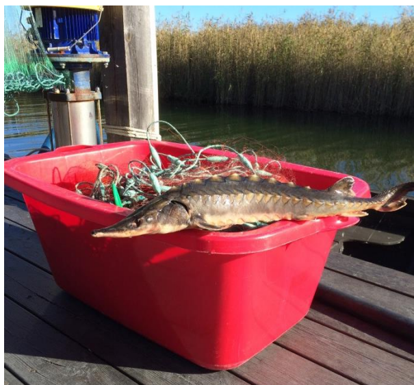
Stör i fångsten 2015