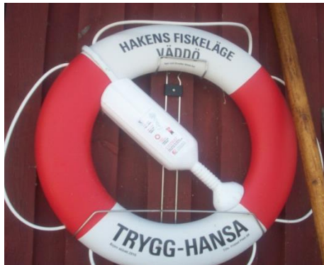
Senneby Haken 2019