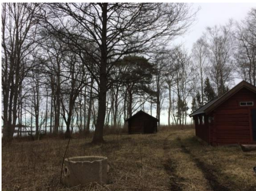
Karviken april 2017

Husbehovsfisket i Senneby bedrevs vid den samfällda skötgården vid Karviken. Benämningen skötgård kommer sig av att det där fanns träställningar där man hängde upp sköterna, näten, för torkning. På skötgården fanns också ett par bodar för förvaring av utrustning.