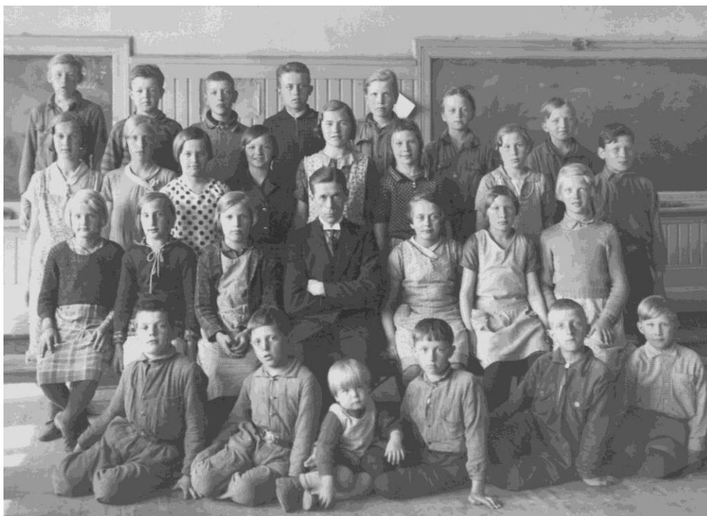
Västernäs 1933, Småskolan; 1:a och 2:a klass: