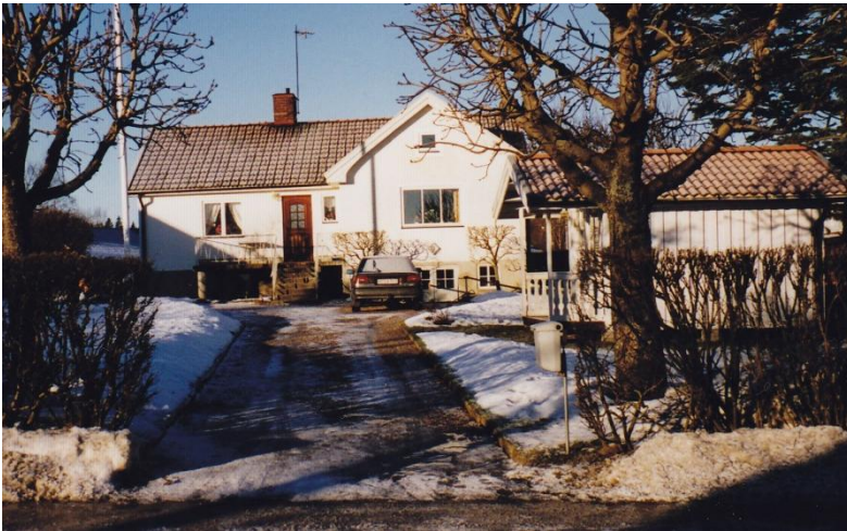
Telegrafstationen där nuvarande ICA ligger idag