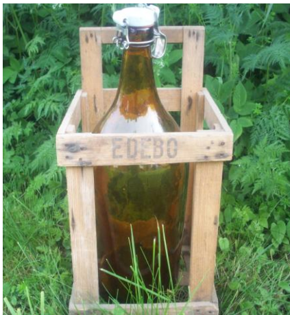
En damejeanne från Edebo