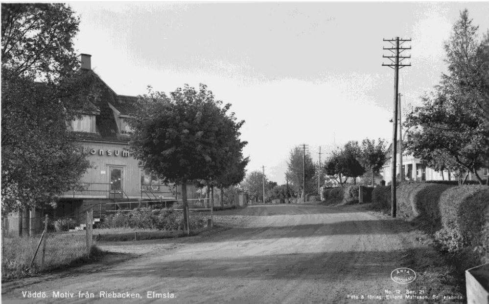
Vaddö. Motiv från Riebacken, Elmsta.

No. 12 Ser. 21