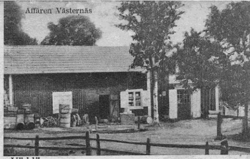
Affären i Västernäs på ett äldre vykort