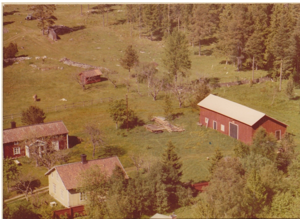
Bilden visar gården med de två fastigheterna och uthus. Bilden är från maj 1966.