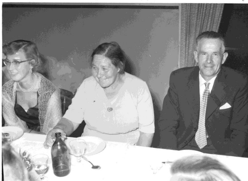
Tillställning på Pensionat Hasselbacken i Gåsvik