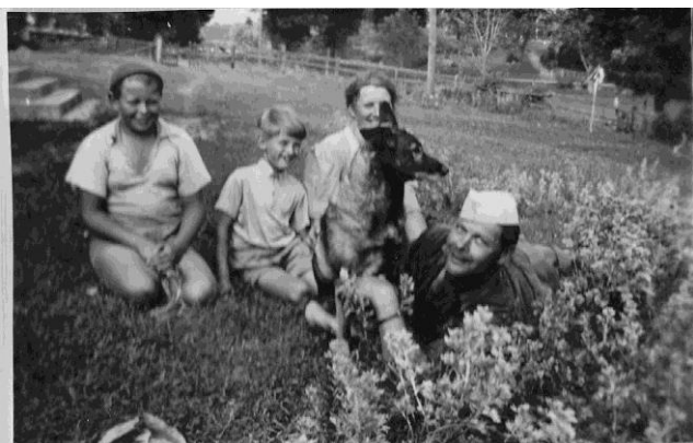
Westerbergs i slutet av 1940 talet.