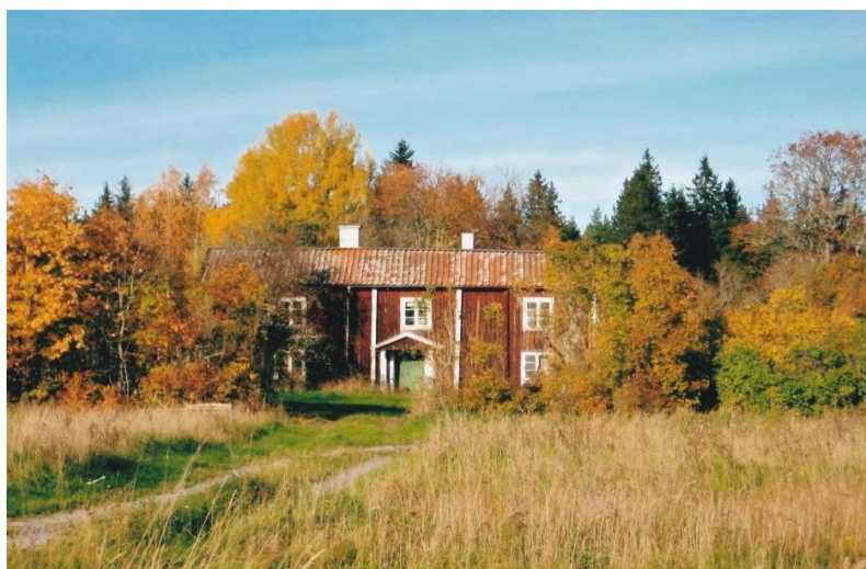
Foto på huset, från senare datum, där skolan var inrymd