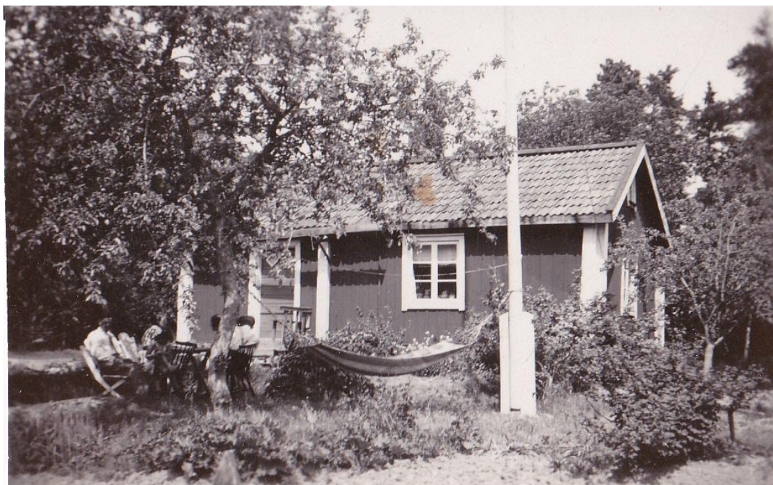
Den ursprungliga stugan i Kasen. Stugan bestod av ett stort kök och en liten kammare.

Sammanställt av Siv Bergquist 2013-06-10