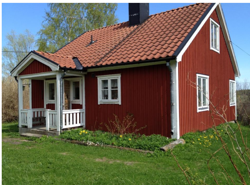
Fastighetens utseende idag.