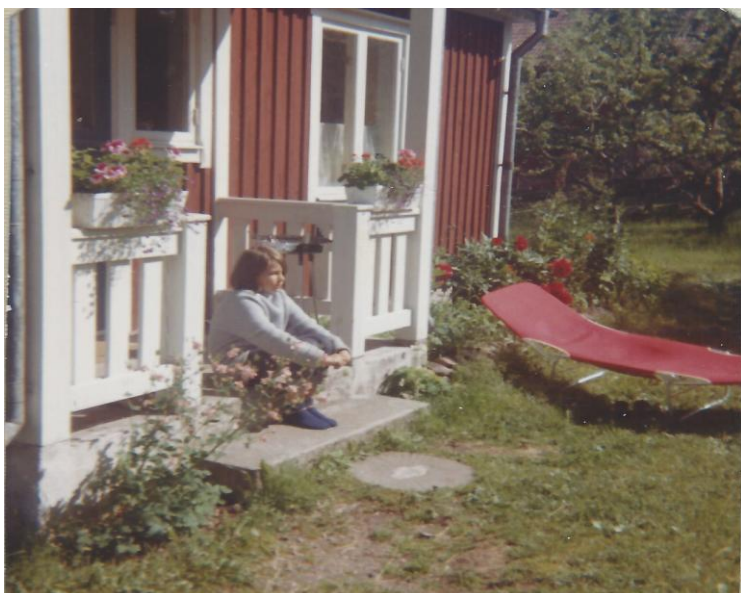
Titi på trappan