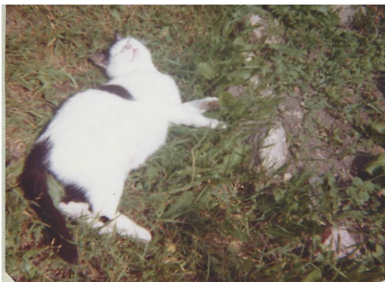
Snurran. Den lataste och den keligaste