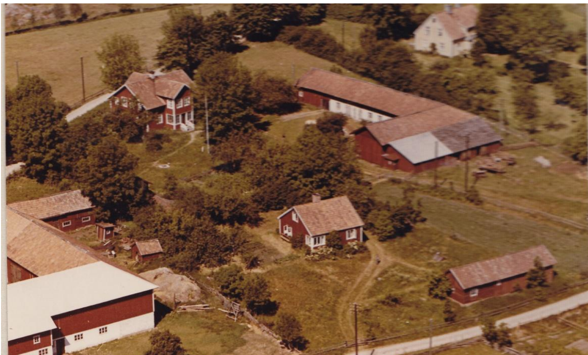
Flygfoto från ca 1964