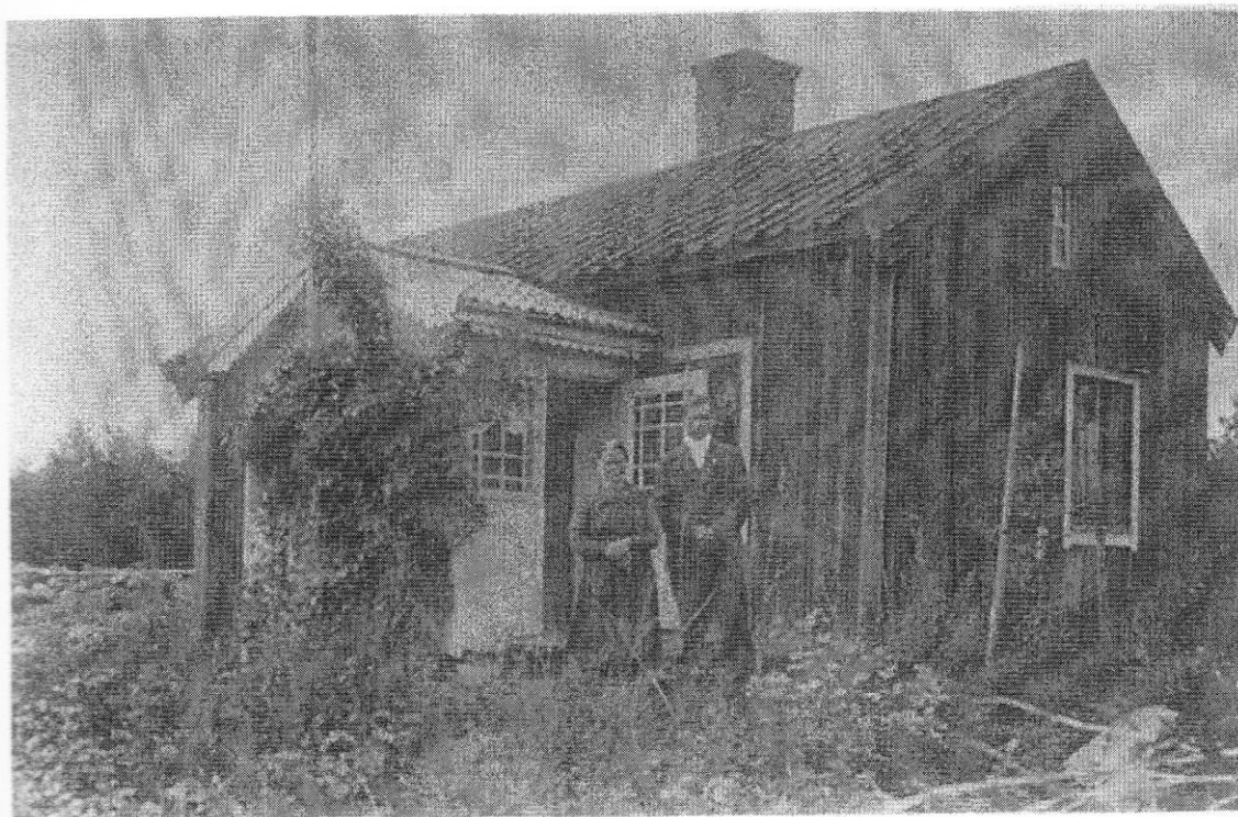
Färgmans, Båtsmanstorp N:o 73.